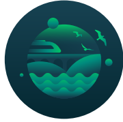
Ulaşım ve Hareketlilik