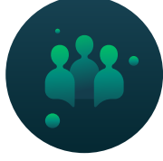
Yönetişim ve Katılımcılık

Altın Karınca kapsamında değerlendirilen proje kategorileri aşağıdaki gibidir :