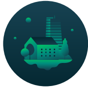
Kentsel Tasarım ve Mimari