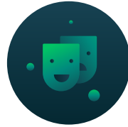
Kültür ve Sanat