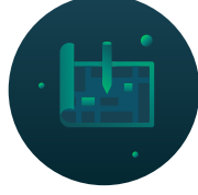
Kentsel Planlama ve Altyapı